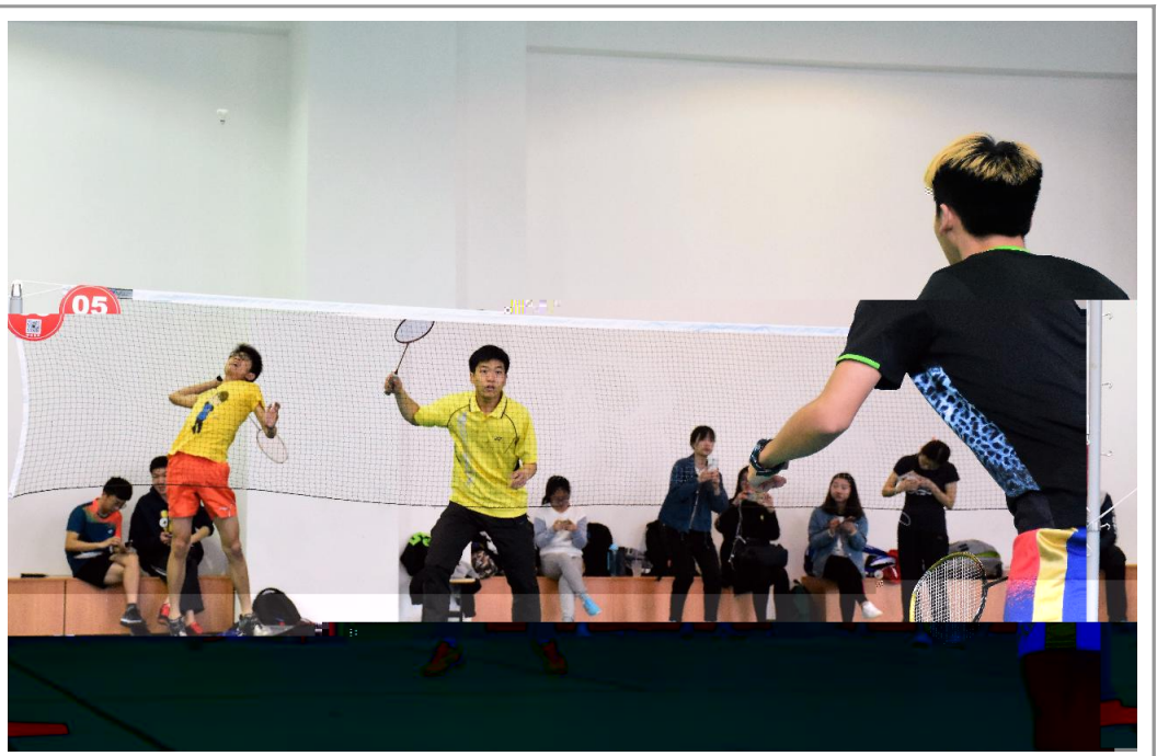
4- 8. /2017Q 232456 789: ; <=>?@ABCD= EFGHI /J KD= LM$ NOPQR9: STPQU 122VSWXYZ[ \V] ^_` aBbcdef ghij kl m>nopL qr EFst luvEFstwxryEUz { R| } ~• a