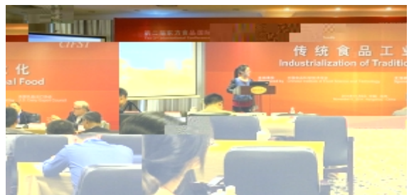
海外表以及GH大学、中国I大、JG大学、华H理工工大学等国内K G校表的一致评。这是!校 究生L U'"会上作专题报告。

Q55的报告是 会组委会专家委 会的7,从申报的m1000v究报告中89L出的。报告内主要通过I重分析法、$ :法、顶);3O<C法等'方法来=直>?粉-•@S~的\AB,C出适i这9体系\ABD的s适方法。报告du了与会的国、日、E国、F、c国等