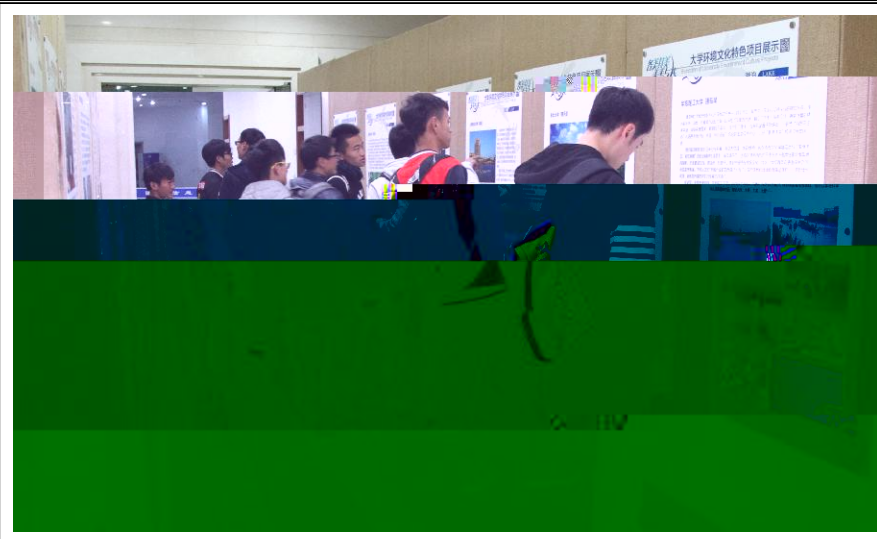
二〇余的 展板，建设成果 ，展，集中呈现了沪上 与 以上所高校 的大 展出，具 大学 展具

！" (通讯员 姜伟杰) 11 11^H ) J 3 ) J v心h[ 1 kf v心hu a对nK师J ( m f v心hp N 两大 m . ) J J H 3本 J I J 3帮 21( 大JJ 项目H ) J J ) 社 / m社 / aH 举/ f h 之 I J 果 N 战 项目Nh 大JJ ) 计大 . 队 a[ 大型 H @ 本 J I J 之 3相互 H 本 J I J Zne m f 项目 3 / HJ f hOP3精 . H对 项目 d 大 H帮 u. 利( ( m f v心h3 x 解 场S [ 3问题HM O师 @ 3hi U 3 J i Qmf v心h3 fp SV ) J J 3 Dm