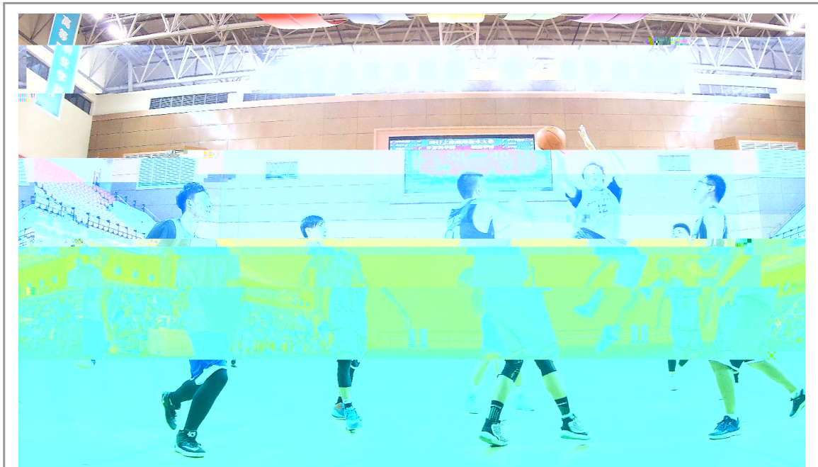
( 6C ; < 78 < 9 : ; < = > 56 2 $ H ! ? @ A 0 E : BC C D E % * F ! G H * I K J K 3 > 0 E KNK = ? ; < 0 6 C * ? 0 E C : %

!) " # 5 20! ". , 取得<G全国大 , - 预 参 N本1 i O等 得 - #大8 PQ&R?: 大 在 F N A 6 参加y 国区 , - - 大8举行" 由 (Microsoft) y 国c N f 自y 大8c华东理&大8c Pearson 培 VUE 和, - u有 近! " , - w <w36f - 理&大8等 14所> = 151 N 限公司t合{办" P8S承 在 y 国(, - )国际w ' 参 N x c 和 办i . / MOS大 华 <?: 3, "O = i 20 " O = 由PQ&R8S 东区 近! 在 = 区举行N 项8 ' 得 成 " $T 指导i 马< 团 项目 O = D 出S" O等 4 得Xw<?业 项目 h 5 目和黄 c 忠 T指导i J e" 等 6e" 等 10e" 项c银 9项c 6项N 团 项目 得大 O等 "b 5e" O = y 得 J 组