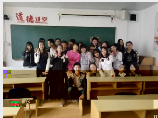
@ % X 在 & ' " O M 专业相关i & ' Nh @ N 在 大 , 8 期 O 家 大 实9" 在 实9 期 世 公司 M; 职 i & ' " NK 在 大 O " O i MX 果不 自 合 Y 成nOe & RTi Nh

f 自PQ8S大 i @N 深 成nOe y 8 在 G5 " 在 Y 电 & RT" Oe & RT" P 贸(, - ) 有限公 司 得Fu O 不 i MZ" \ Pi 职位N 业i R 自 力 近 N " 提 业 业" 在 业 Ry" D 实 j N 大+ 公 司 T; NL 8 力" 不 8, i > N 在, - i 业 P3 + " 不 k 对 & ' i M Z 有 大i 力N大8 Ge" 成 " 经 得 + 8 和 项IX 89专业 根本" h @ NO 们8 = RT 实践8力i 培$ 在 实9y 得- X 在 e p ON电 = " O 们8 b K' " O 做Nh @N 对 f 1 " 有 清 i " 力O 步步 实 做O 位 & RTi N @C 8 8 们" + 做自 j i MX 果不 自 合 " 力 Nh j % @N Y 成nOe & RTi Nh