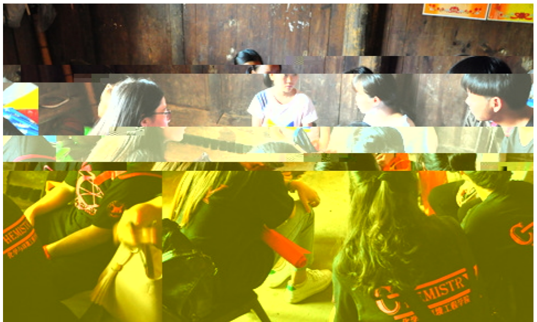
暑[ C_a 3000 @` 7=q00 @` D R\EnF 社会 78活{ C Gsl 考Hq社会调c dRS帮l q环J KL dR益M。q - L 78等方面C 双N77; ; O} Ps 真' 78着 T 合_ @*, * *

Q。她表示,本次活o前期,学校e 5精X筹划,努力使每一位学员都能] 8收获、] 8提9。宗爱东• 讲话中FG>O板块、红色板块、创新板块、制造板块、文p板块五V方面对此次S践研修活o; 排e5 介绍。他 学员• 研修M程中[ R “、\、R” 步研修法,认真讲、积极NO、12努力、de 创新,努力: 3一 的 。 仪7后,上海市 年学生校 . 活o联4会议办_• 书长 ,上海9校vx课教学改革协e组组长 平,上海大学 俊、 先后e5专O讲{ ,FG“上海 革 文pP发利R”、“9校vx工 e改革创新”、“中国H列 ” vx 课的 与S践U Oe5深入 : Q。 23456789: &