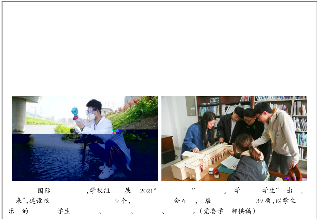
国际...学校组展2021“...”。学...学生“出、...”。(党委学...部供稿)

学校第三届教职工健康文化节开幕式暨“学党史、悟思想、办实事、开新局”主题活动于5月12日在校内举行。